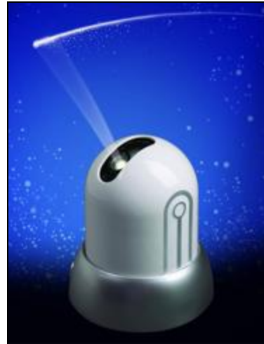
Декоративный проектор Discovery Shooting Stars in My Room

Проекционное устройство Discovery Shooting Stars in My Room по доступной цене $30 позволяет по вечерам создавать на стенах и потолке умиротворяющую картину звездного неба. Но это еще не все!