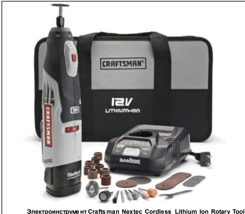
Электроинструмент Craftsman Nextec Cordless Lithium Ion Rotary Tool

из светящуюся надпись максимум из 7 букв. Для питания пульта дистанционного управления используются 6 AAA-батареек. Ночью прохождение могут воспринять такую игрушку как неопознанный летающий объект.