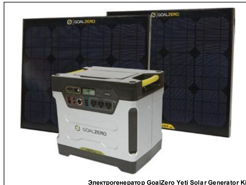
Электрогенератор GoalZero Yeti Solar Generator Kit