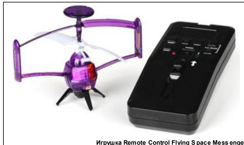
Игрушка Remote Control Flying Space Messenger

Хотите, чтобы ваша девушка увидела ночью за окном парящую в воздухе светящуюся надпись LOVE? Тогда вам срочно нужно приобрести необычный радиоуправляемый вертолет Remote Control Flying Space Messenger по доступной цене $40. Он имеет по бокам специальные выступы с полосками и светодиодами, которые по заданной программе во время полета мигают при определенной частоте вращения, что дает возможность видеть в возду-