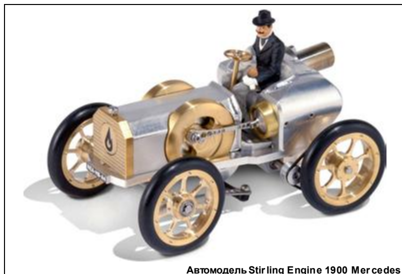
Автомодель Stirling Engine 1900 Mercedes